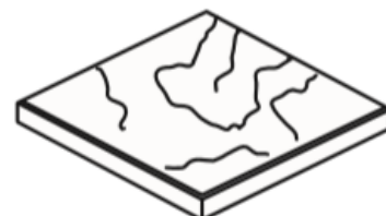
Obr. č. 1 – BŘIDLICE TRYSKANÁ, RELIÉFNÍ 40 / 40 / 4

3.4. Jednoduchá opravitelnost poškozené dlážděné plochy.